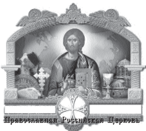
Православная Российская Церковь

24 июня 2005 года состоялась 3-я сессия Поместного Собора Православной Российской Церкви: подведены итоги жизнедеятельности и церковного строительства; избран Предстоятель и Высший Церковный Совет ПРЦ