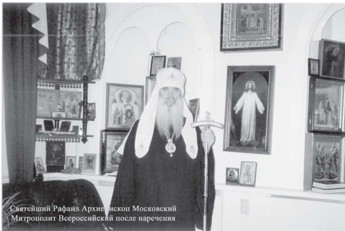
Святейший Рафаил Архиепископ Московский Митрополит Всероссийский после наречения

Первосвященителя Истинно Православной Церкви, Святейшего архиепископа Московского, митрополита Всероссийского РАФАИЛА